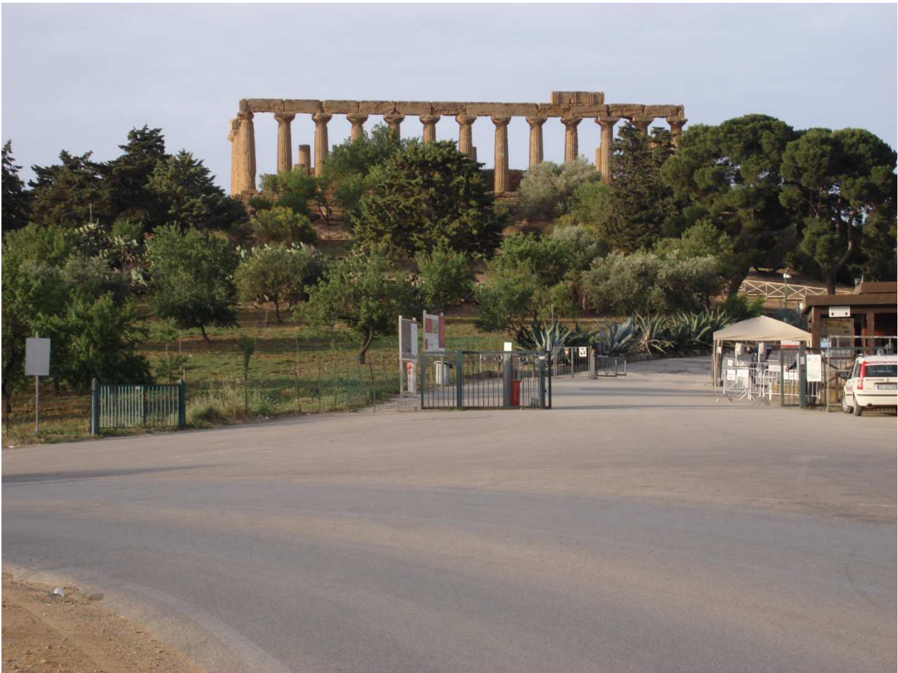
Ingresso Giunone - Biglietteria

Responsabile procedimento _____ (se non compilato il responsabile è il dirigente preposto alla struttura organizzativa) Stanza _____ Piano _____ Tel. _____ Durata procedimento _____ (ove non previsto da leggi o regolamenti è di 30 giorni) Ufficio Relazioni con il Pubblico (URP) e-mail: urp.parcoag@regione.sicilia.it Responsabile: _____ Stanza _____ Piano _____ Tel. 0922 621657 Orario e giorni ricevimento _____